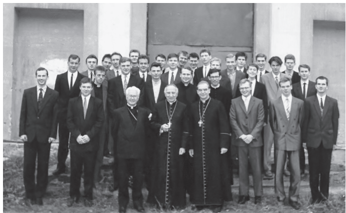
1995 m. seminarijoj viešėjo Vatikano Katalikiškojo auklėjimo kongregacijos prefektas kardinolas Pio Laghi.

Mano giliu įsitikinimu, kiekvienas iš jūsų turėtumėte galvoti, kad esate neverti kunigystės. Jeigu turėsite tokią nuostatą, tai jau bus neblogai.