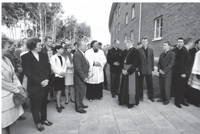
Simbolinio rakto įteikimas arkivyskupui metropolitui A. J. Bačkiui

Atmintis mus daro žmonėmis – gyvuliukai atminties neturi. Tai nereiškia, kad visi turi žinoti kažkokias datas. Svarbiau už pačią seminariją tai, kad ji – Vilniaus arkivyskupijos istorijos sudėtinė dalis. Kiek ši seminarija yra Vilniaus arkivyskupijai būdingos krikščioniškos tapatybės dalis, tiek ji turi atsiminti šitą ir visas kitas seminarijas: ir senąją, ir vyriausiąją, kuri vėliau tapo akademija ir buvo iškelta į Peterburgą, ir Alumnatą, skirtą unitų mokymui ir ugdymui. Visa tai reikia atsiminti, bet stiprybė kyla iš šiandieninės veiklos, o atmintis tiesiog daro žmonėmis. Tačiau, jei neatsimeni, kas buvo prieš du šimtus metų, kaip gali atsiminti, kas buvo prieš du tūkstančius?