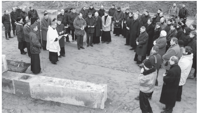
Kertinio seminarijos akmens pašventinimas 1997 m. kovo 4 d.