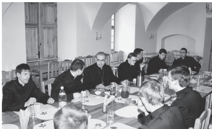
Arkivyskupas bendrauja su klierikais

Buvo siekiama aukšto intelektualinio lygio, bet vis dėlto akcentuotas ne mokymas, o ugdymas. Man atrodo, kad nepavykus pritraukti prel. Rubšio tapo akivaizdu, jog kažin ko čia vietoje akademinė prasme sukurti nepavyks. Žmones reikia ugdyti, o gabius siųsti į Romą. Žmonių studijuoti išvažiavo daug, faktiškai visi, kurie galėjo: visiems rado stipendijas, kur gyventi, ką daryti. Taigi mąstyta taip: pirmiausia kandidatai turi būti motyvuoti, žinoti, ką daryti, rasti savo pašaukimą, o tada intelektualinis ugdymas vienu ar kitu būdu ateis.